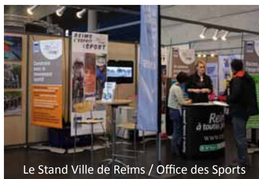
Le Stand Ville de Reims / Office des Sports